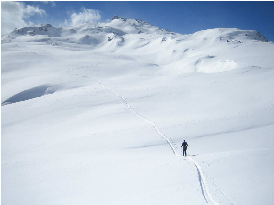
Im Anstieg zum Hüttenkopf von Norden anlässlich der ASM-Tour vom 04.-05.03.2016